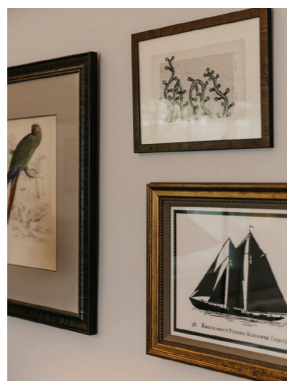
17 TABLEAUX D'UNE DES CHAMBRES DU ROSEWOOD LE GUANAHANI ST. BARTH