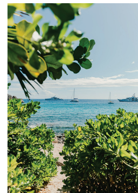
14 ANSE DE GOUVERNEUR