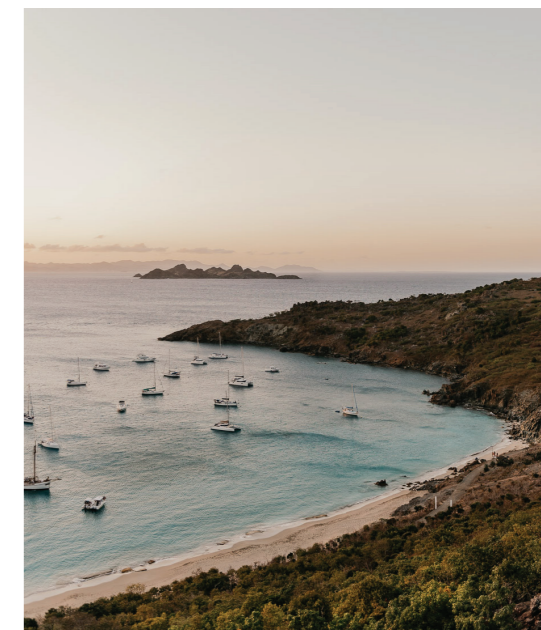
11 OVERLOOKING ANSE DE COLOMBIER