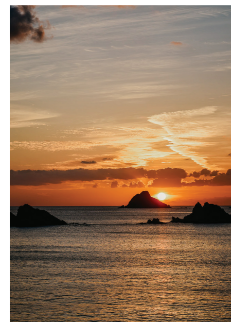
13 COUCHER DE SOLEIL SUR SHELL BEACH

Shell Beach est un endroit idéal à visiter en bateau. Près de l'eau, il y a une corde sur laquelle vous pouvez grimper puis sauter dans l'océan à une altitude de 5, 8 ou 10 mètres. C'est difficile à faire, mais amusant.