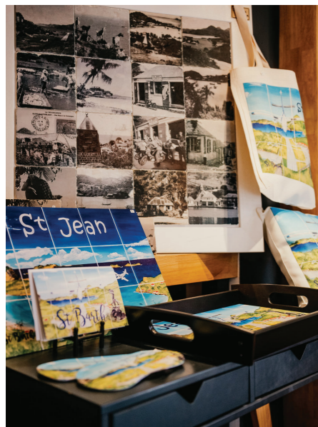
06 LES PETITS CARREAUX - BOUTIQUE