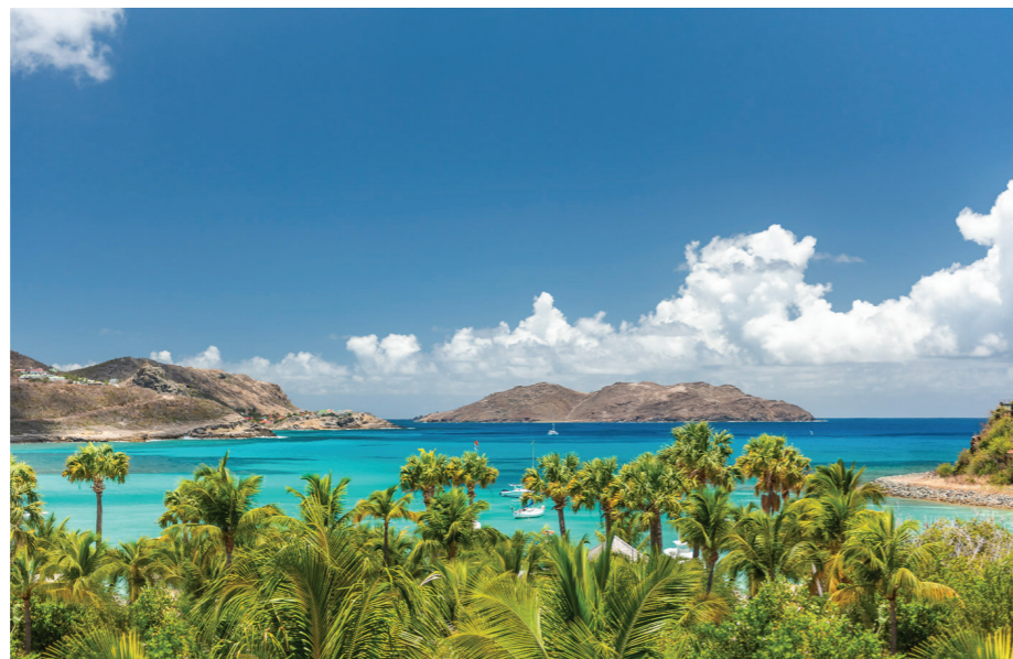
07 BAIE DE ST JEAN

Comment vous est venue l'idée de peindre les carreaux représentant les plages de l'île?