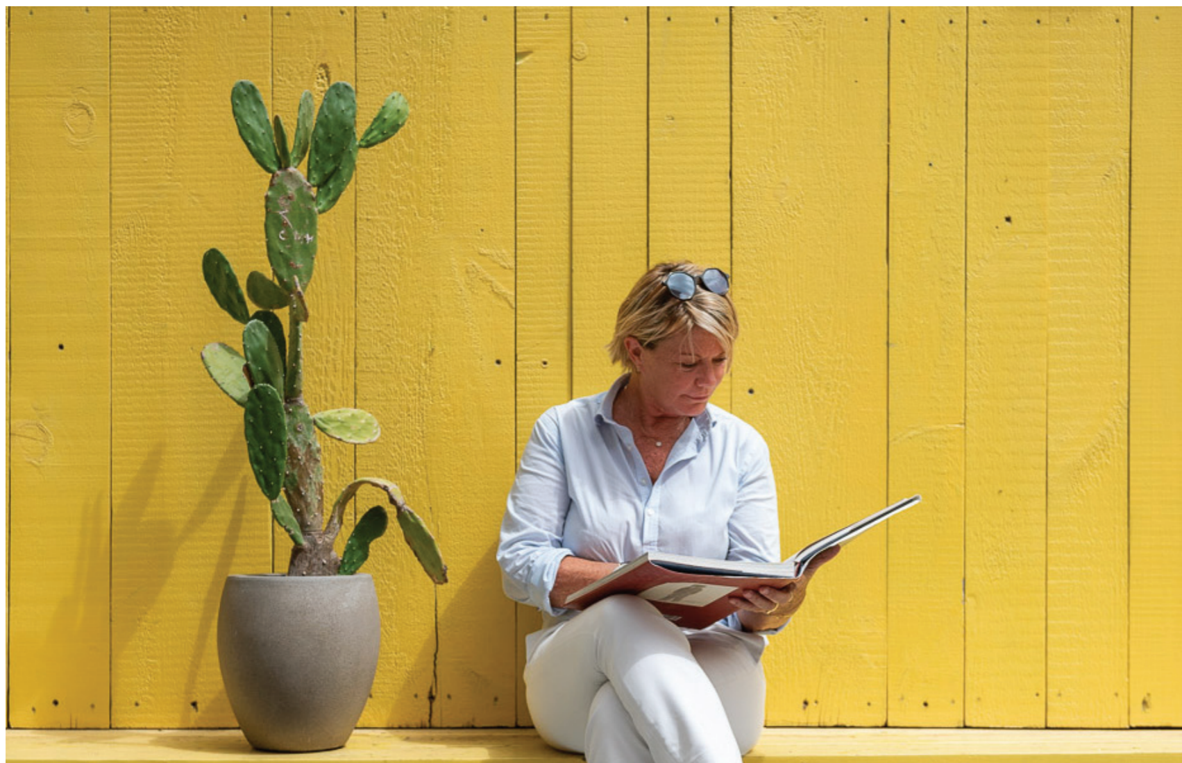
18 TLES COULEURS VIVES DE GUSTAVIA