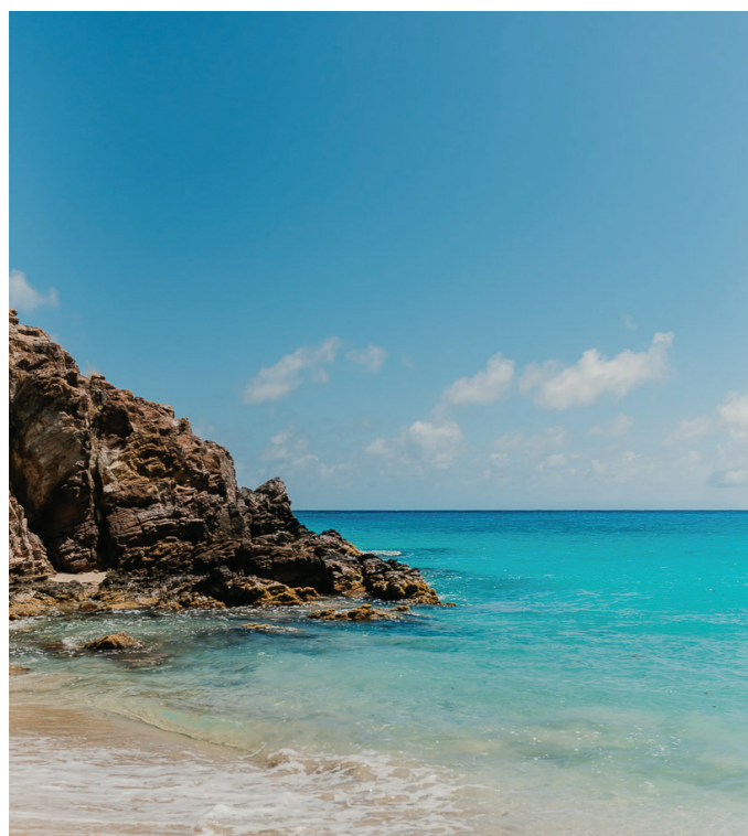
09 SPLAGE DE SALINE

Véronique partage son Jardin secret d'où elle puise son inspiration