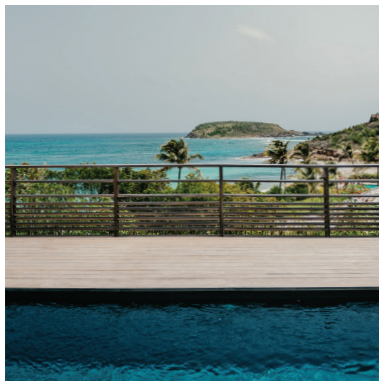
16 VUE DE L'ANSE MARÉCHAL